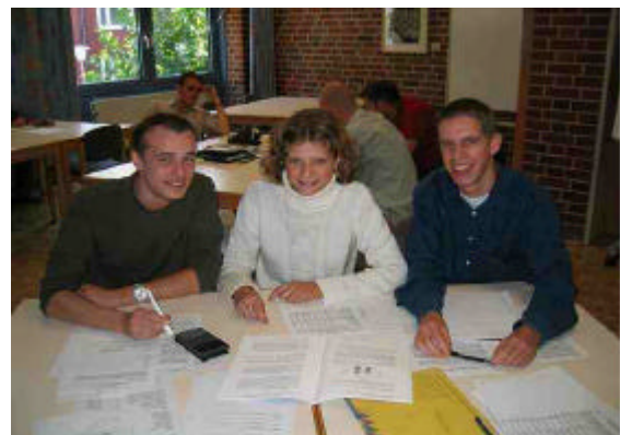
Projektleiter während der Spielrunde

Bereits über 40 BVH Mitgliedsvereine haben sich schon für die diesjährige Spielrunde angemeldet. Weitere Vereine haben ebenfalls ihr Interesse gezeigt. Das Bundesprojektteam von bankmasters ist derzeit dabei, die Vereine beim Vermarkten des spannenden sowie sehr anspruchsvollen Spiels zu unterstützen. Ganz in diesem Sinne veranstaltete der BVH Ende September 2003 das Projektleitertreffen in Münster.