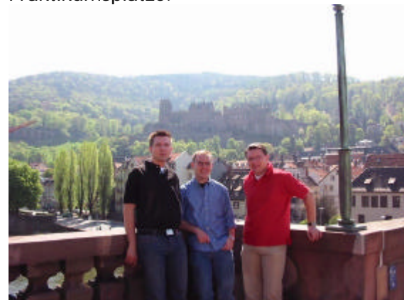
Der Vorstand des Vereins

Im November wird sich die Initiative Wertpapier Heidelberg e.V. auf der BVH Homepage präsentieren. Der Verein hat sich zur Aufgabe gemacht, seinen Mitgliedern eine möglichst weitgehende Praxisnähe zu verschaffen. Zu diesem Zweck organisiert er Vorträge namhafter Börsianer, bietet Exkursionen zu Hauptversammlungen an und vermittelt Praktikumsplätze.