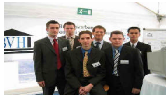
Das BVH Team auf dem Bankenforum

Am 04.10.2003 fand an der European Business School (EBS) das 12. Bankenforum zum Thema ‚Navigating through the economic crisis‘ statt. Zahlreiche Unternehmen wie Citigroup, Deutsche Bank, Boston Consulting Group und Goldman Sachs waren vertreten, um Young Professionals für sich zu werben. Zum BVH Stand kamen meistens Studenten, um sich über den Verband zu informieren sowie um verlockende Preise beim ‚Armbrustspiel‘ zu ergattern. Die interne Kommunikation des BVH konnte dadurch verbessert werden, daß aktive Mitglieder der Vereine aus Berlin, Saarbrücken, Hannover, Halle u.a. den Stand besuchten.