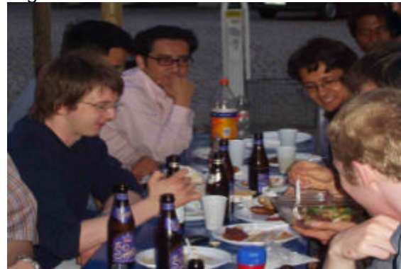
Regionaltreffen in Kassel