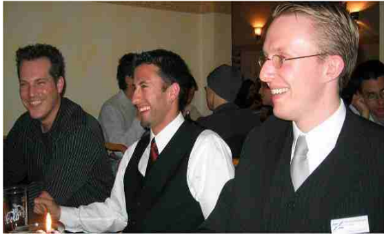
Vorstandsvorsitzende der BVH Vereine aus Köln, Augsburg, Nürtingen und Stuttgart

Des weiteren fand an diesem Wochenende in Nürtingen die dritte BVH Vorstandssitzung statt, auf der das Kernthema die bevorstehende außerordentliche Mitgliederversammlung mitsamt Vorstandswahl in Hamburg war.